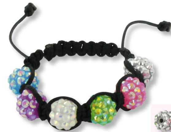
Cordon central noir Ø 1 mm - Cordon de tressage noir Ø 1,7 mm Perles "disco"